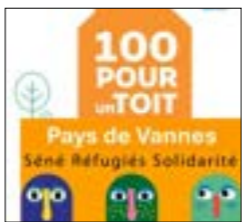
Table Ronde. Les 100 pour 1 Toit, une initiative citoyenne qui mobilise. 100 personnes se regroupent pour sortir une famille de la rue, la loger et l'accompagner jusqu'à sa prise d'autonomie complète. Présentation du modèle 100 pour 1 Toit, ici et ailleurs. Elargir la réflexion sur la force du réseau associatif investi dans l'aide aux personnes exilées. Proposé par Séné Réfugiés Solidarités.

■ Samedi 7 Février - 10h30 - Séné - Grain de Sel.